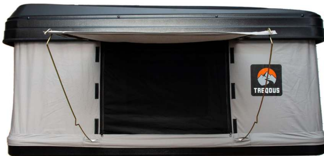
Trepous Hardshell Aurora