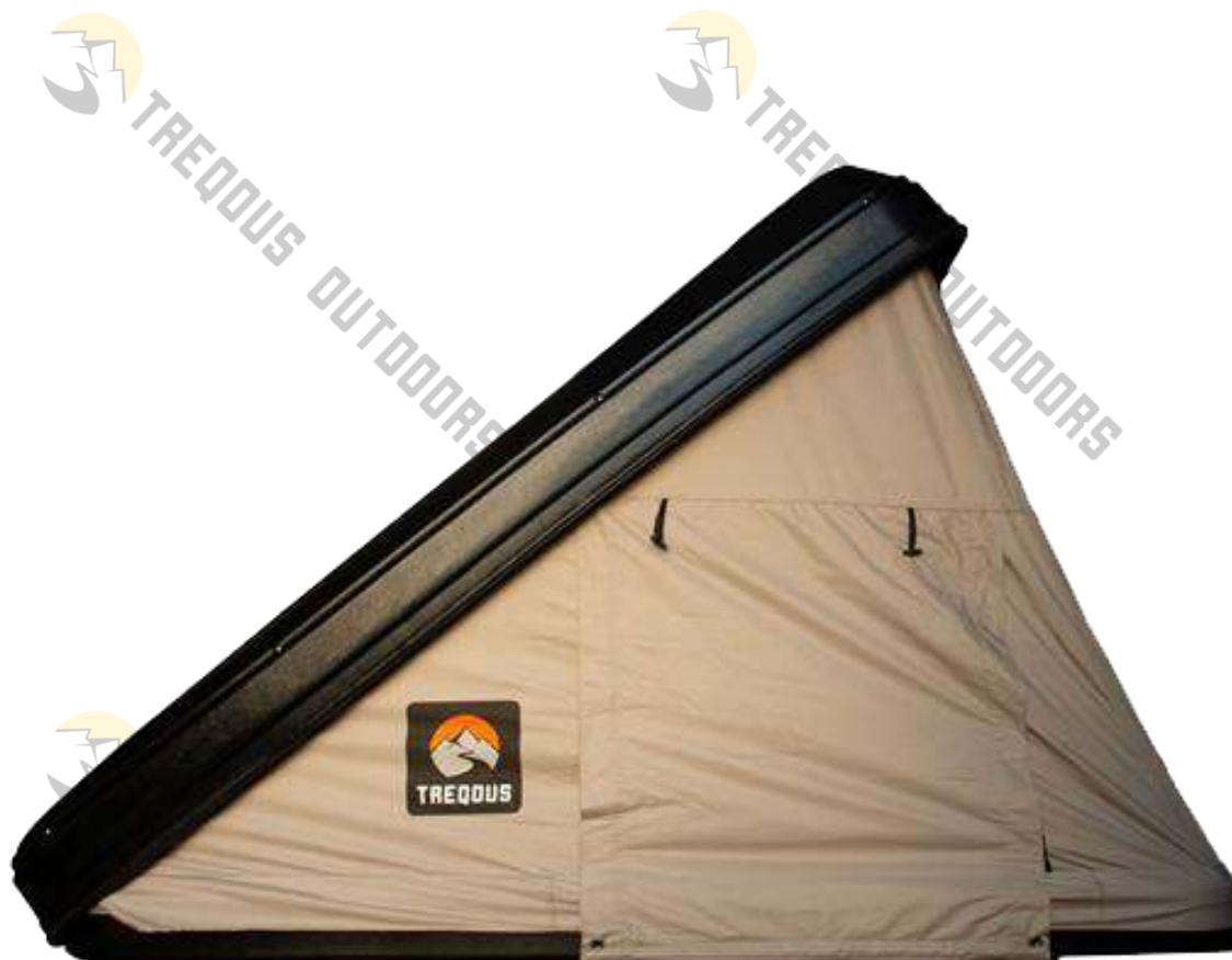
Trepous Hardshell Borealis