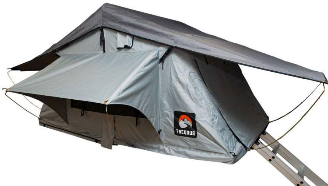
Trepous Softshell Polaris