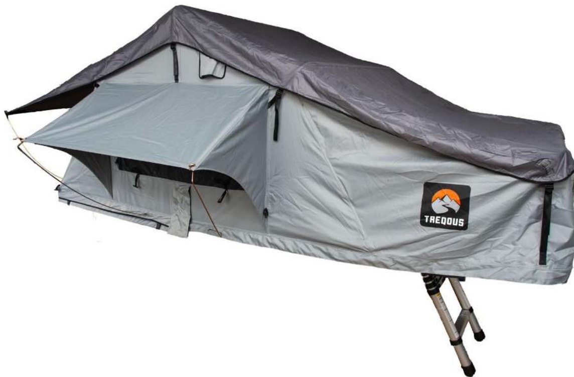
Trepous Softshell Mizar